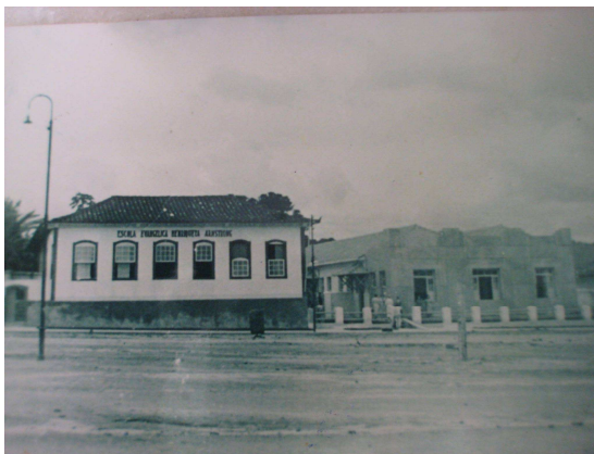
Escola Evangélica Henriqueta Armstrong – Foto Célia Marçal.

em um mundo totalmente diferente, respirou fundo e aceitou o desafio.