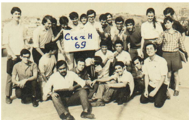
Alunos do Colégio Universitário 1969

Em março de 1969, mudou-se solitariamente para cursar o terceiro ano científico no famoso Colégio Universitário, da Universidade Federal de Minas Gerais.