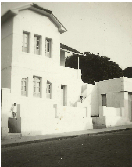
Residência em Campo Belo

Ao término de uma destas missas os seus pais foram chamados a ter uma conversa particular com o Pe. Pedro, vigário local.