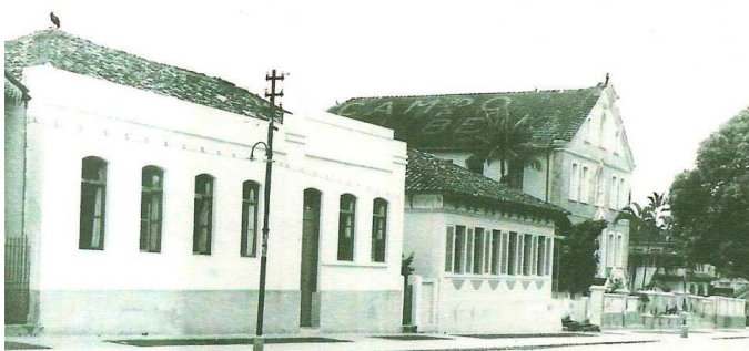
Colégio São José

O primeiro ano primário, daquela criança, por ironia do destino, não foi proveitoso. Logo no início do segundo semestre os meus pais receberam uma comitiva do Colégio São José, que tinha por objetivo informar que o seu filho não mais poderia estudar naquela escola tradicional.