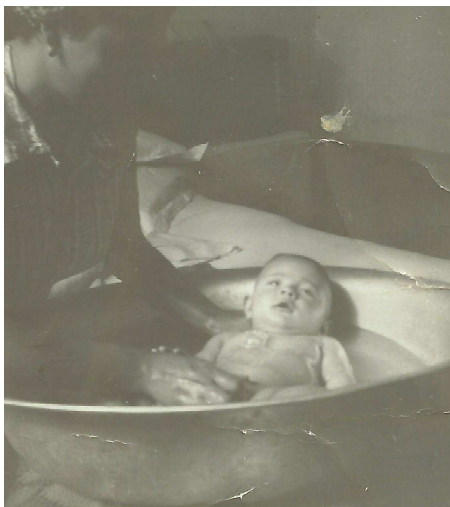
O menino com 2 meses de idade

Muito branquinho o recém-nascido teria que passar pela sua primeira prova de existência. Não havia unidade de tratamento neonatal na cidade e como desafio foi adaptado um cesto para que o colocassem em um local de temperatura constante.