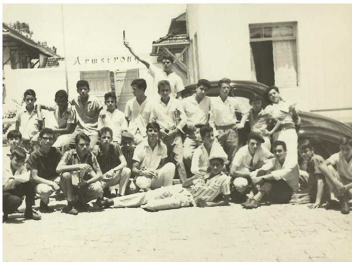
Alunos do Colégio Armstrong 1966

Pai! Disse o menino. As escolas religiosas são criadas para catequizar os alunos em primeiro lugar, depois é que pensam em ensinar a matéria. A divina liberdade de escolha, o livre arbítrio foi um presente de Deus para nós. Quero voltar para o Colégio Armstrong, disse ele.