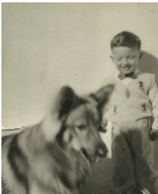
O cão Tilzinho – Autor desconhecido

O nome do cachorro foi dado logo no primeiro dia de convivência. Tilzinho.