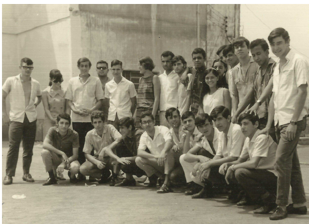
Alunos do Colégio Dom Cabral 1968

No Colégio Dom Cabral as amizades de adolescentes ainda perduram até hoje, onde os alunos abençoados por mestres de respeito construíram o alicerce de suas vidas profissionais.