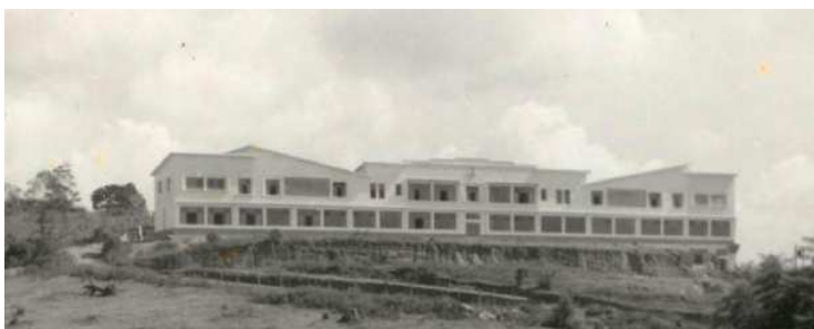
Colégio Dom Cabral

No Colégio Dom Cabral as amizades de adolescentes ainda perduram até hoje, onde os alunos abençoados por mestres de respeito construíram o alicerce de suas vidas profissionais.