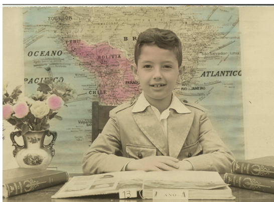
Terceiro ano primário